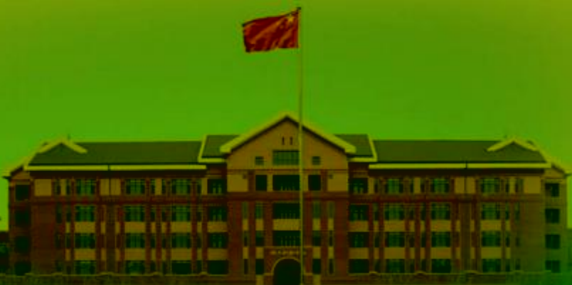
天津机电职业技术学院

TIANJIN VOCATIONAL COLLEGE OF MECHANICAL AND ELECTRICAL ENGINEERING